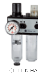
CL 11 K-HA