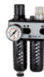
CL 11 S