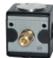
A 11 F