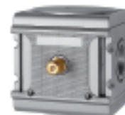
A 55 F