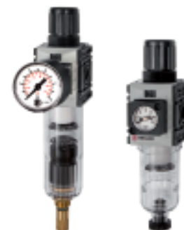
FUM 821-8 FUM 821-8-KM