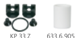
KP 33 Z