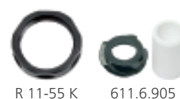
R 11-55 K 611.6.905