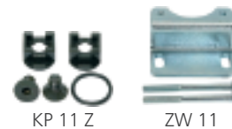
KP 11 Z