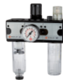
FRL 11 K-HA