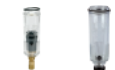
KS 11 F-A