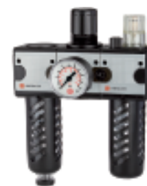
FRL 11 S