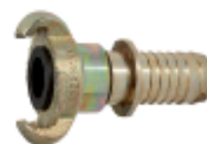
KT 25 SBD