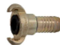
KT 25 D