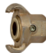
KI 34 M