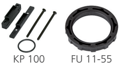
KP 100 FU 11-55