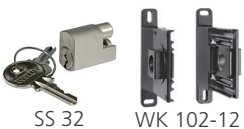
SS 32 WK 102-12